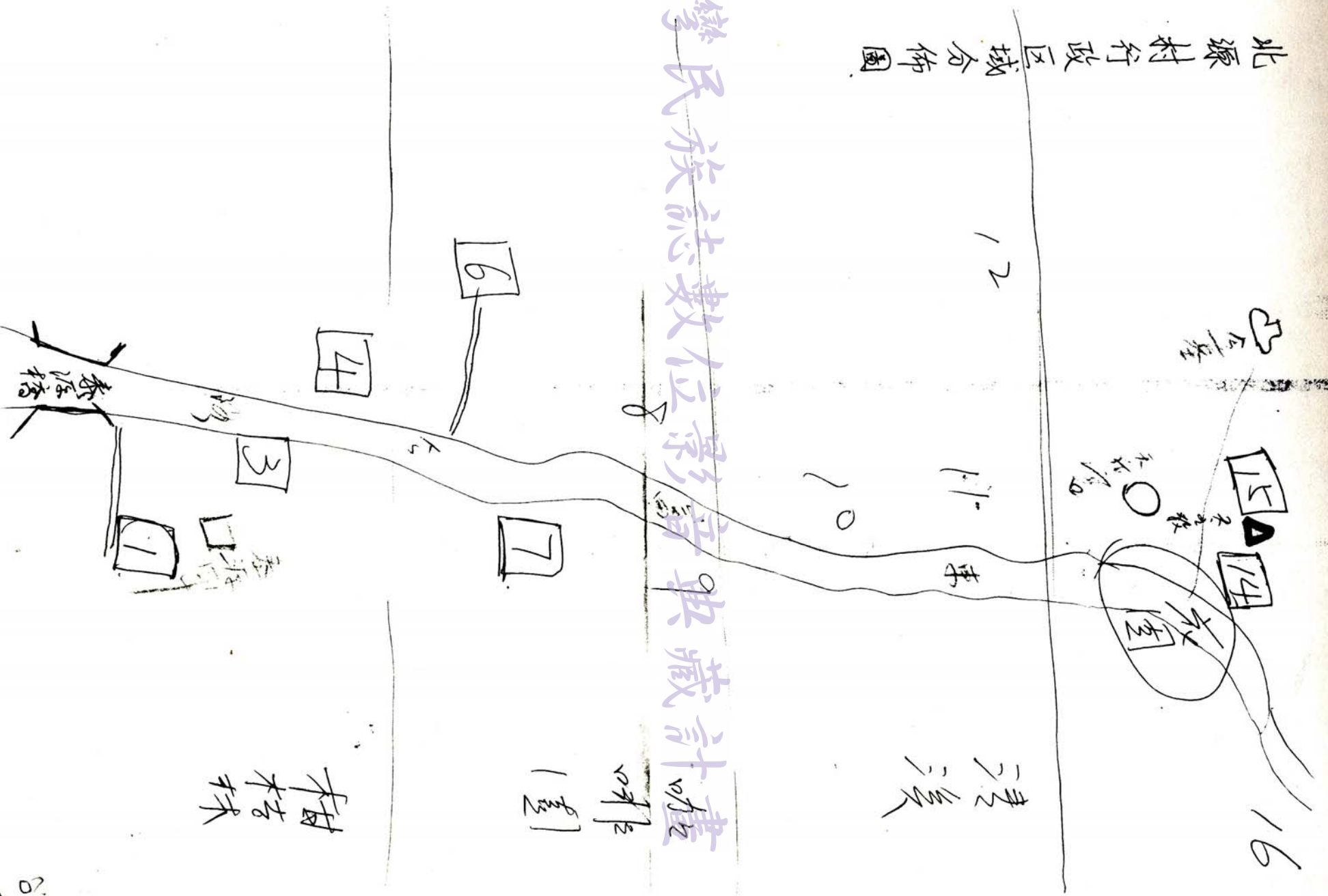
北源村行政区域分佈圖